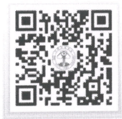
中国保健协会 官网专栏页